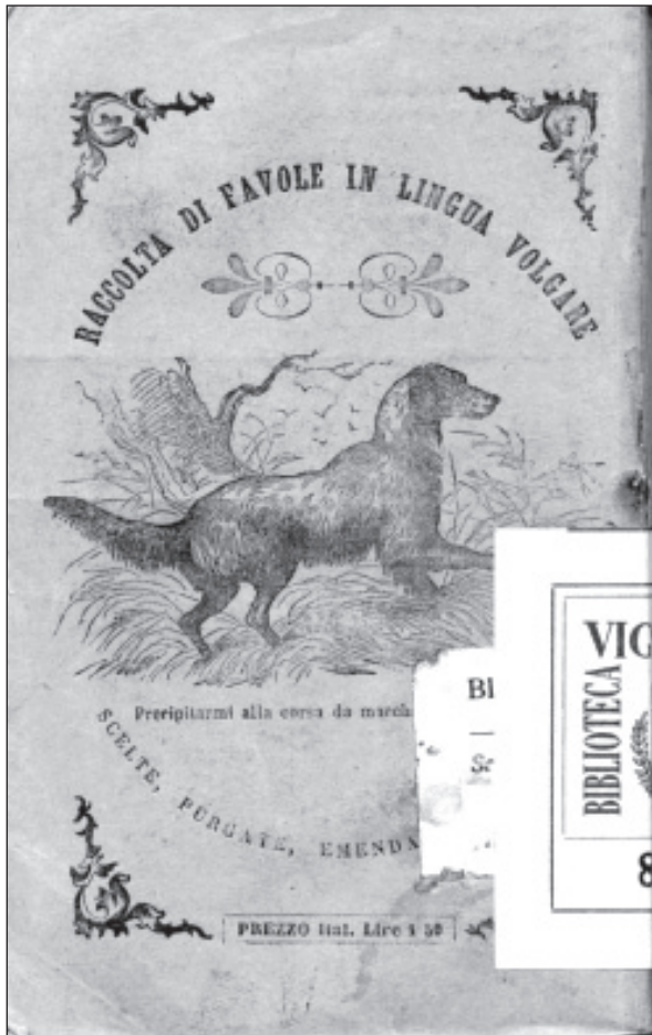
Retro de "Il favoleggiatore", Torino, 1857.

fondamentali del percorso di costruzione dell'Italia unita, come della propria esperienza personale.